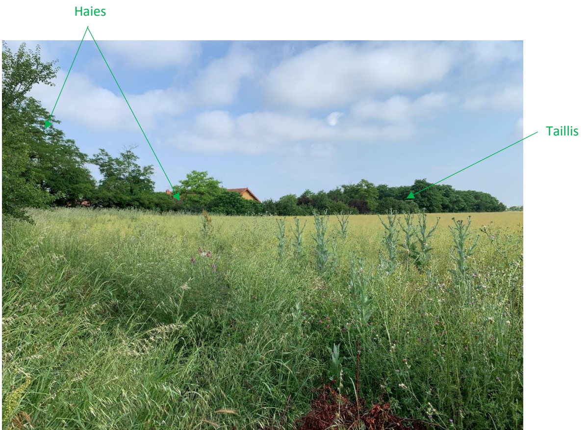
Vue depuis le sud-est de la parcelle