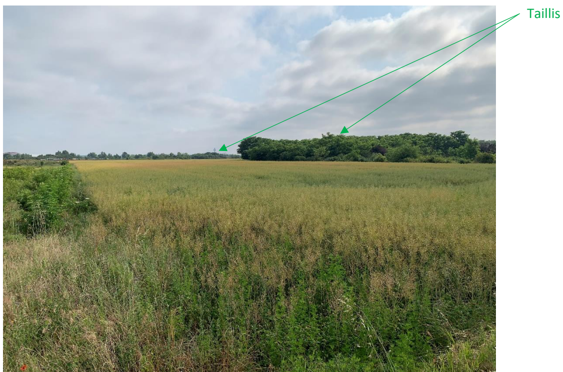
Vue de la parcelle depuis le coin sud-ouest