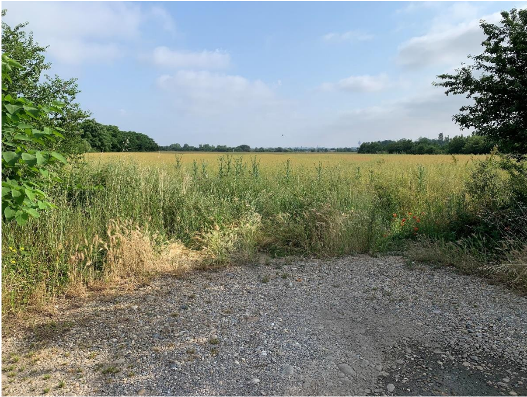
Accès tracteur au sud-est de la parcelle