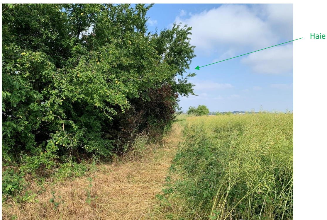
Haie au sud-ouest de la parcelle